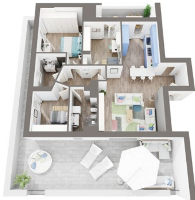
Sopra planimetria di un appartamento all'ultimo piano con terrazza e balcone