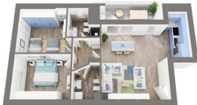
Sopra planimetria di un appartamento al primo piano con loggia