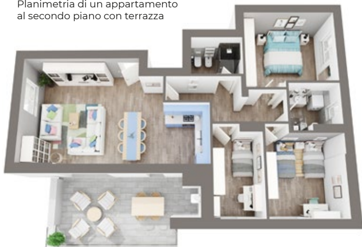
Planimetria di un appartamento al secondo piano con terrazza