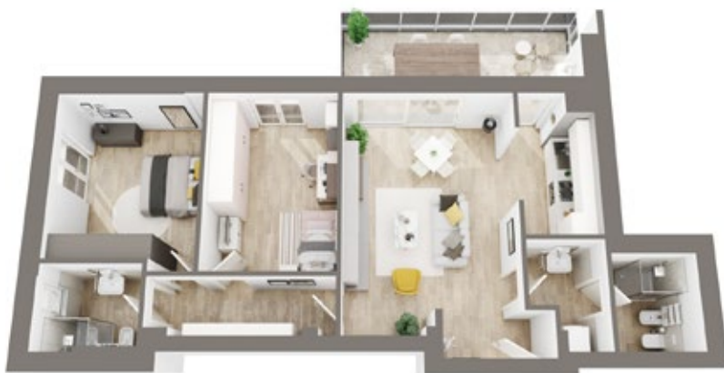
Sopra planimetria di un appartamento all'ultimo piano con terrazza