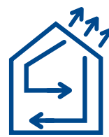
Raffrescamento ad aria