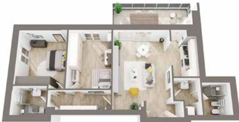
Sopra planimetria di un appartamento all'ultimo piano con terrazza