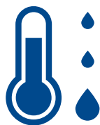
Produzione di acqua calda